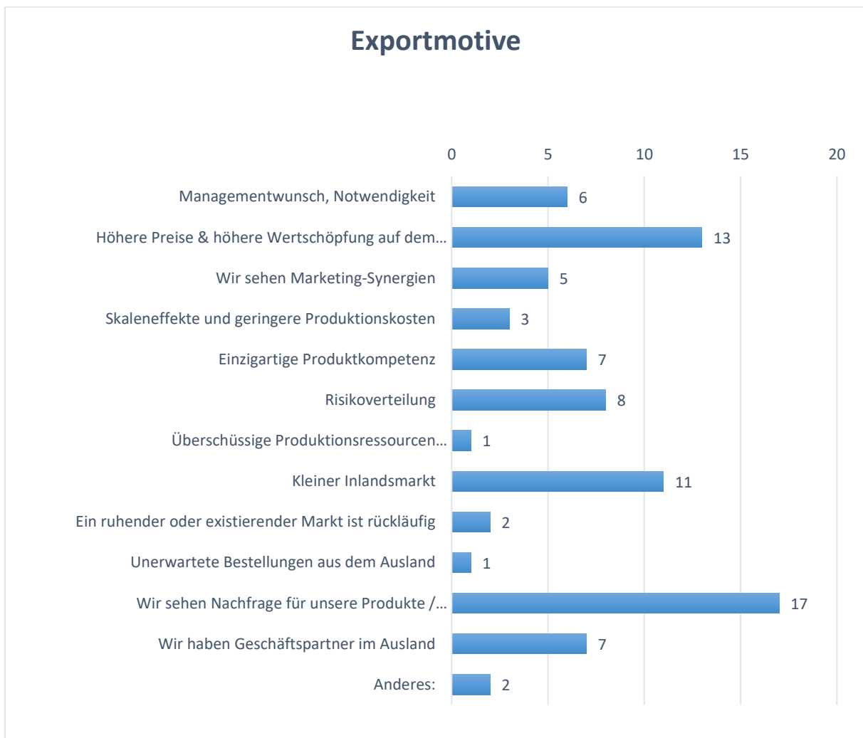
Grafik: Auswertung der Antworten zu Frage 9 „Identifizieren Sie die wichtigsten MOTIVE für die Internationalisierung innerhalb des Unternehmens“

Die klein- und mittelständischen Betriebe sehen bereits eine Nachfrage für ihre Produkte im Ausland und nennen dies als wichtigstes Exportmotiv, um nun neue Geschäftskontakte in die Schweiz und nach Italien zu gründen. Darüber hinaus sind höhere Preise & höhere Wertschöpfung in den Zielmärkten als vergleichsweise auf einem kleinen Inlandsmarkt das zweithäufigste Exportmotiv.